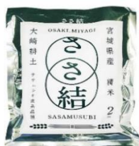
ささ結 2kgプレゼント